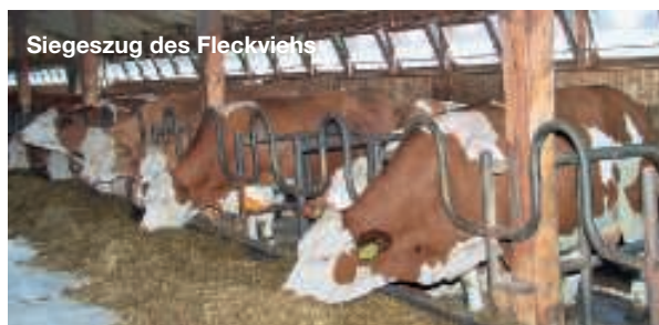
Siegeszug des Fleckviehs