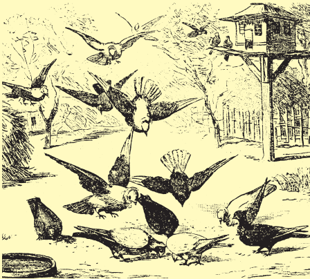
Fütterung im Hof

Bei den Feldflüchtern wird man selten verlassene Junge finden, bei den Racetauben, welche man meistens nicht fliegen läßt und auf dem Schlege hält, desto mehr. Faule Eier und verküppelte Junge, Flügellähme und andere Krankheiten sind häufige Zugaben, welche schon manchen Züchter veranlaßten, die Weiterzucht der einen oder andern Art aufzugeben. Man hat